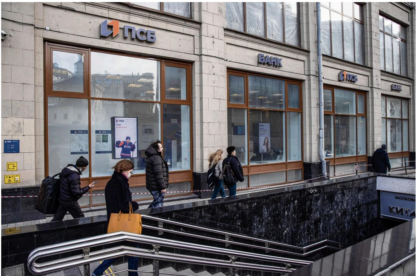
Een filiaal in Moskou van de Promsvjazbank.

✍ Jorg Leijten 🕒 15 oktober 2022 ⌚ Leestijd 2 minuten